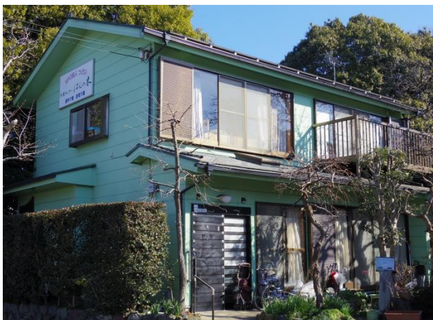
特定非営利活動法人つどい 「介護センター はんの木」

「南町をもっと知ろう」第二弾は南町6丁目にある「介護センターはんの木」をご紹介します。樹木に囲まれ家庭的な雰囲気印象的な「はんの木」。どのような事業を行っているのか、林センター長にお話を伺いました。