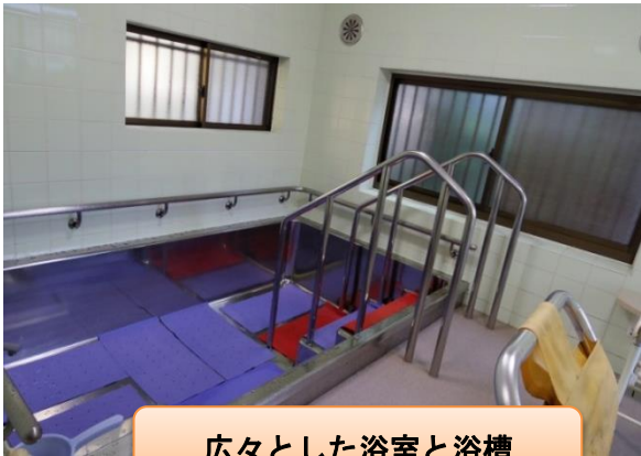
広々とした浴室と浴槽