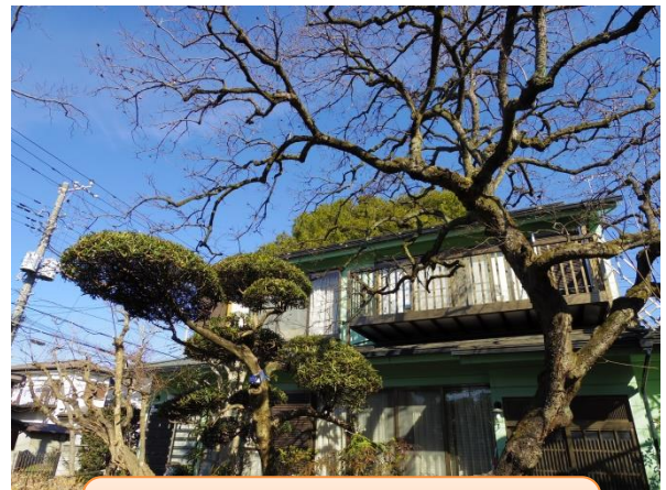
庭の柿の木は樹齢150年！？ 果実はおやつに。