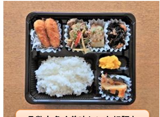
品数も多く美味しいと好評な 昼食のお弁当